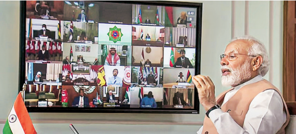
PM Narendra Modi during the Non-Aligned Movement Summit via videoconference in New Delhi on Monday

The coronavirus crisis has shown the world the limitations of the existing international system and the need for a new template of globalisation, based on fairness, equality, and humanity, Prime Minister Narendra Modi said on Monday at a video-conference of leaders of the Non-Aligned Movement (NAM). The prime minister said humanity is facing its most serious crisis in many decades and that NAM can help promote global solidarity as it has