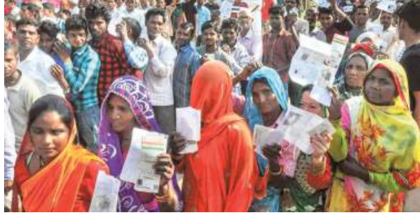
Voters wait in long queues to cast their vote at a polling station in Moradabad on Tuesday

In the three adjoining seats of Rampur, Moradabad and