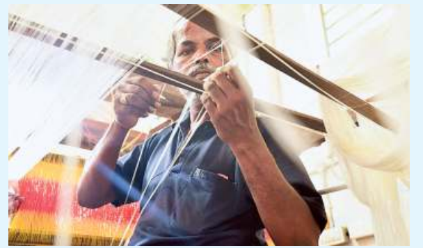
Weavers nowadays get a weekly wage of just ₹1,200-1,300

'Losing an identity' However, things changed in 1999-2000, when the place was under curfew for 30 days