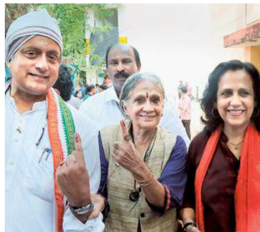
Congress leader Shashi Tharoor and his mother after casting their votes in Thiruvananthapuram