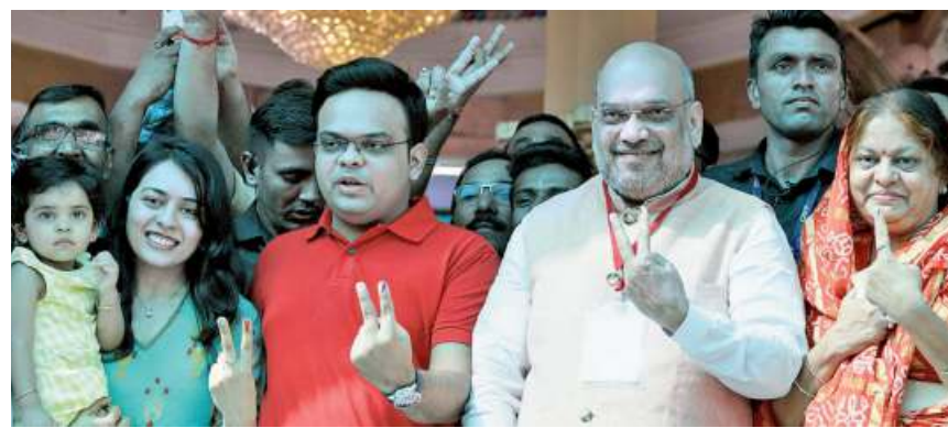
BJP President Amit Shah, along with his family, in Ahmedabad

"Rahul Gandhi said he made the statement in a euphoric manner," Rohatgi said, adding that Gandhi had made the wrong statement without reading or seeing the order.