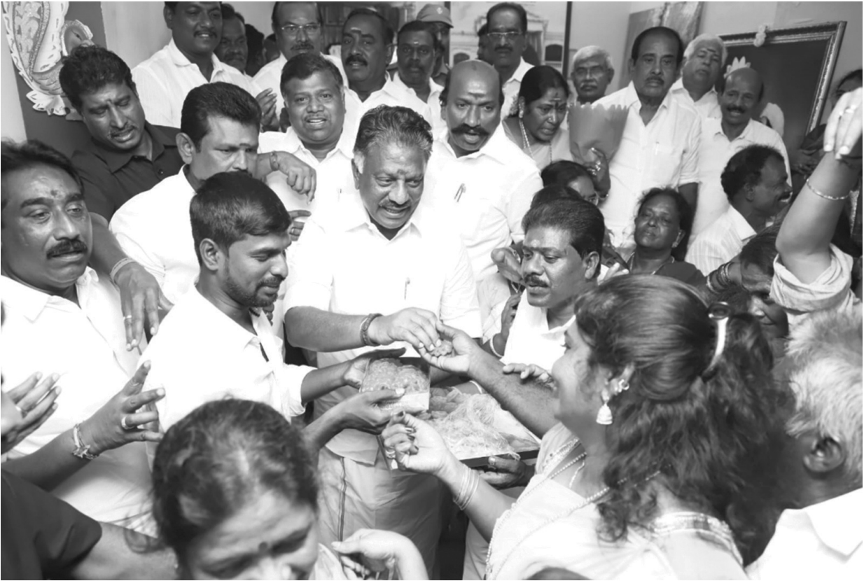
விக்கிரவாண்டி, நாங்குநேரி தொகுதி இடைத்தேர்தலில் அண்ணா தி.மு.க. அமோக வெற்றி பெற்றதையடுத்து, அவரது இல்லத்தில் துணை முதலமைச்சர் ஓ.பன்னீர்செல்வம் அனைவருக்கும் லட்டு வழங்கினார்.