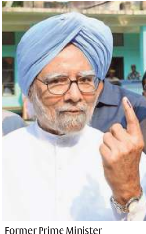
Former Prime Minister Manmohan Singh at a polling booth in Guwahati