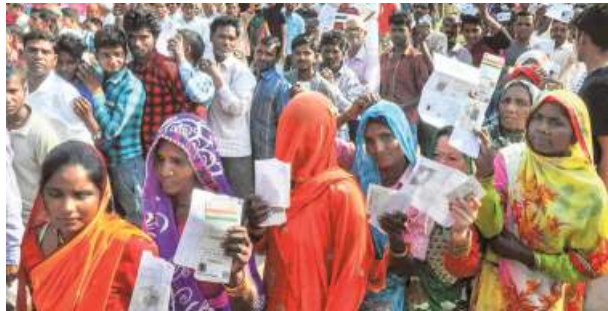
Voters wait in long queues to cast their vote at a polling station in Moradabad on Tuesday PI

In the three adjoining seats of Rampur, Moradabad and