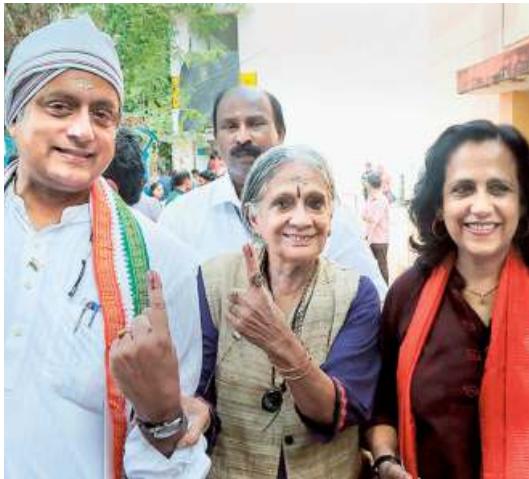
Congress leader Shashi Tharoor and his mother after casting their votes in Thiruvananthapuram