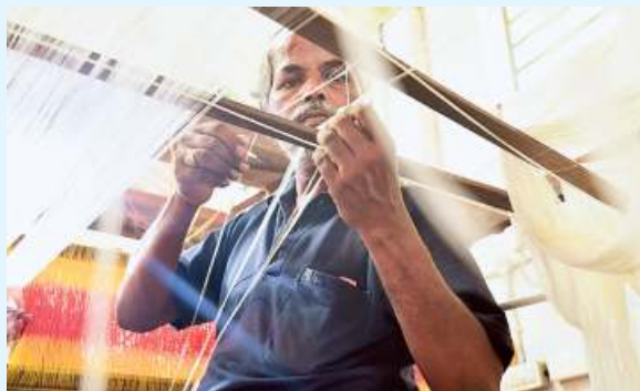
Weavers nowadays get a weekly wage of just ₹1,200-1,300

However, things changed in 1999-2000, when the place was under curfew for 30 days