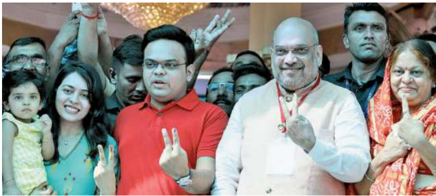
BJP President Amit Shah, along with his family, in Ahmedabad

"Rahul Gandhi said he made the statement in a euphoric manner," Rohatgi said, adding that Gandhi had made the wrong statement without reading or seeing the order.